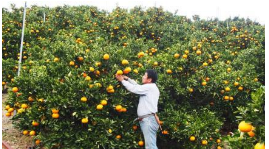
たわわに実った伊予柑園