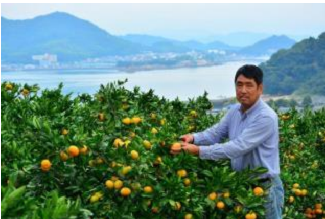
瀬戸内海を望むみかん園地

私は最初から農業をやっていたわけではありません。実は最初、地元量販店に勤務していました。そこでの販売や商品管理の経験は農業を経営していくうえでとても役に立っています。