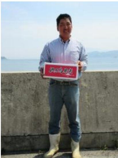
自慢の興居島みかん