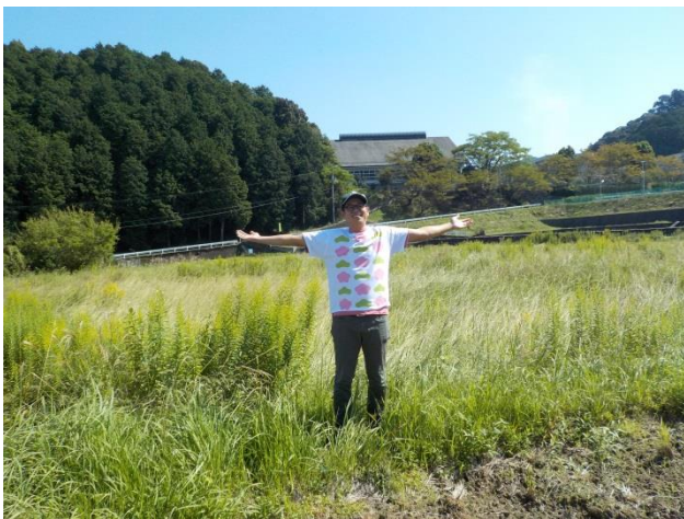
将来のうめ園地をバックに