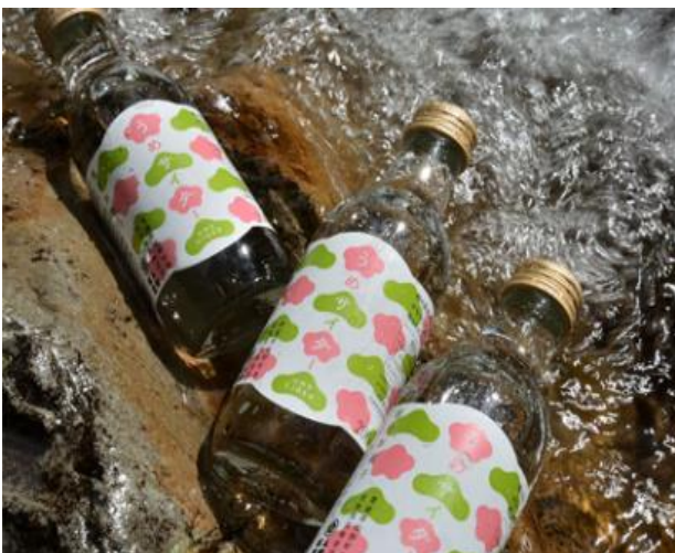
飲料メーカーとのコラボ商品“うめサイダー” パッケージは松野町の「松」と「梅」をデザイン

消費者の健康志向もあり、うめの需要は伸びると感じています。今後は、規模拡大や地元スタッフを雇用して法人化し、ふるさとの魅力を伝えていきたいと思っています。