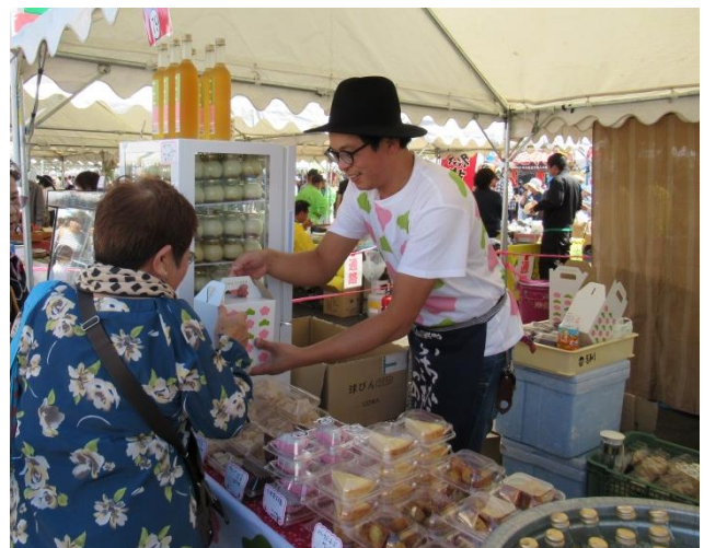
地元イベントで旬の果物を使用したスイーツを販売