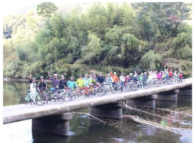
サイクリングの仲間と