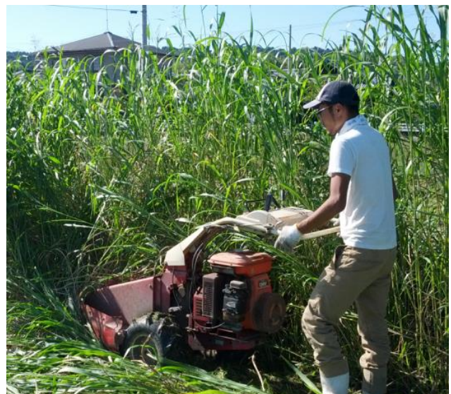
自給飼料の収穫作業