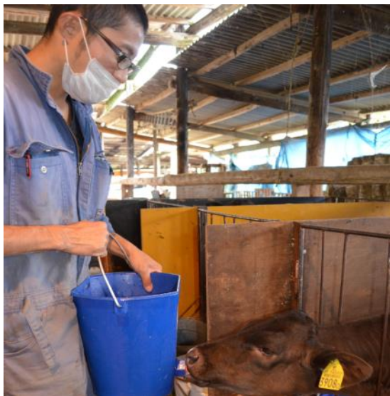
子牛へのほ乳作業

和牛繁殖経営で独立を目指すため、家畜人工授精師免許を平成24年に取得。黒毛和牛繁殖部門を新たに設立し、1年1産を目指した管理を行っています。