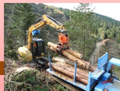
☆グラブで素材を積込