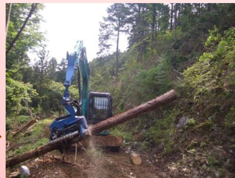
☆プロセッサで伐倒木を玉切