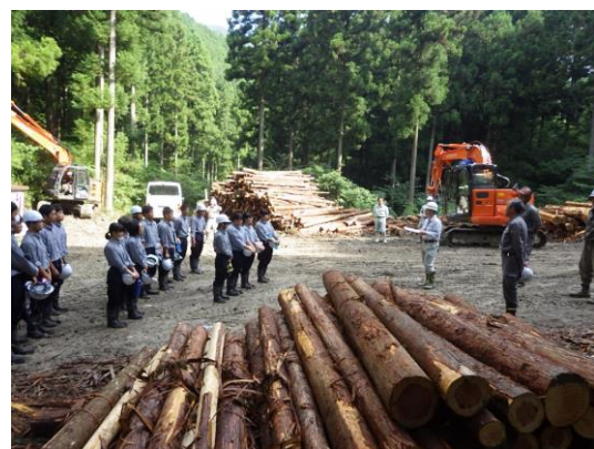
上浮穴高校インターンシップと