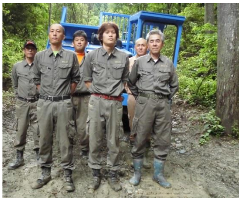
若い社員の皆さんと