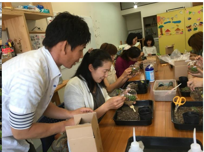
多肉植物の寄せ植え教室