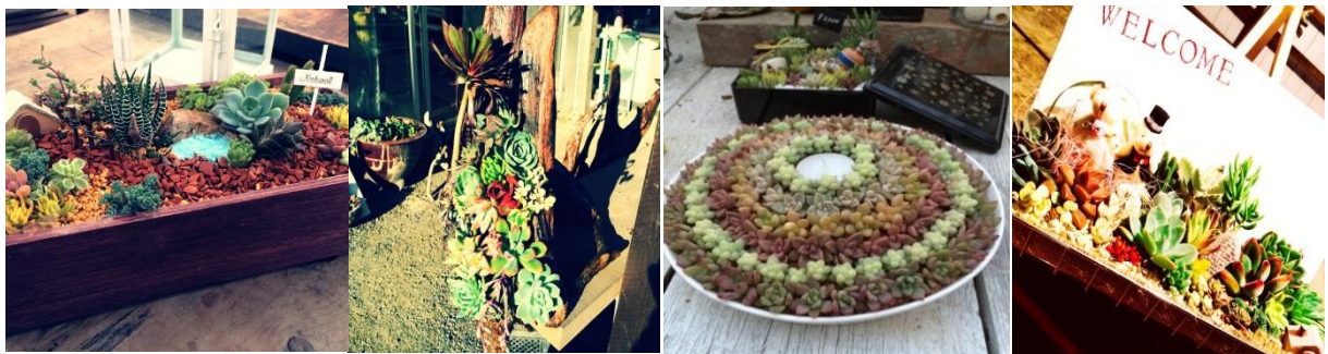
栽培している多肉植物