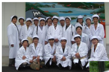
アグリベンチャー21