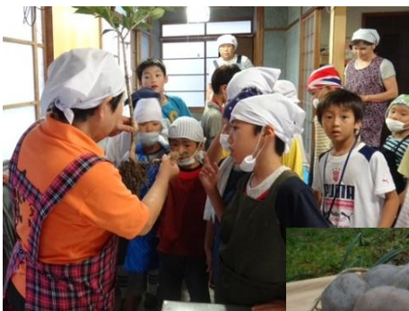
コンニャク作り体験