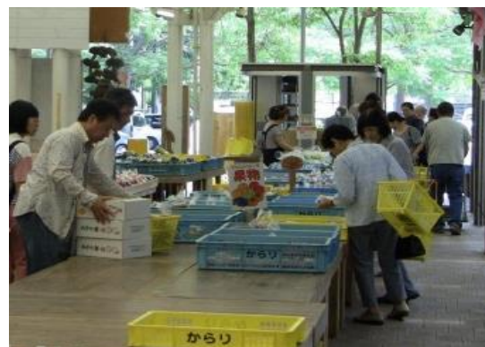
フレッシュパークからり