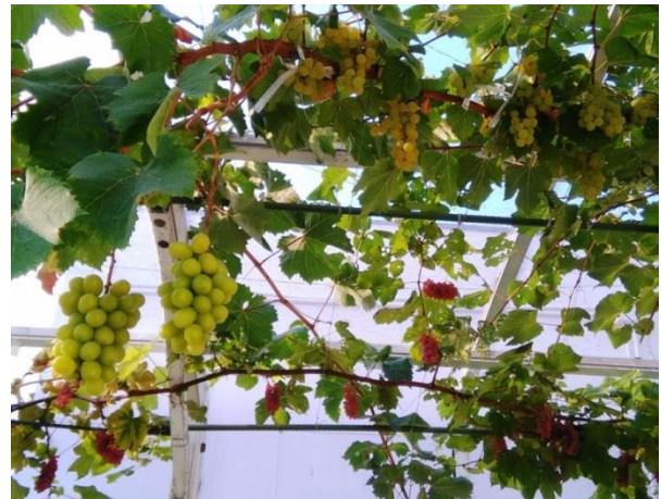
家庭菜園のぶどうたち