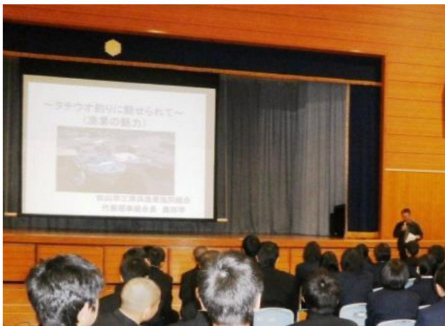
「漁業の魅力」を伝える出前授業