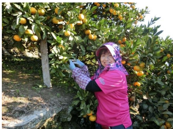
みかん山での作業

この活動の前提にあるのは、あくまでも生産者であるということ。みかん作りに日々励み、日本一の美味しいみかんを作ることが原則。「みかん愛」あってこそこの活動です。