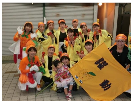
フレッシュレンジの活動