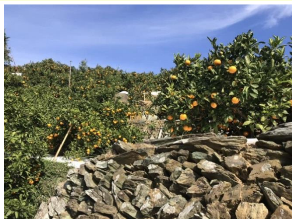
100年経過した石垣のあるみかん山