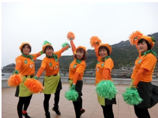
歌うみかん生産者・フレッシュレンジのメンバー