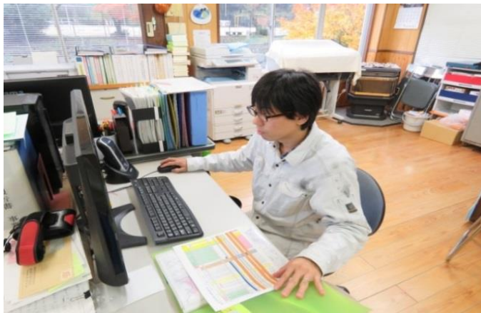
各種データ入力事務