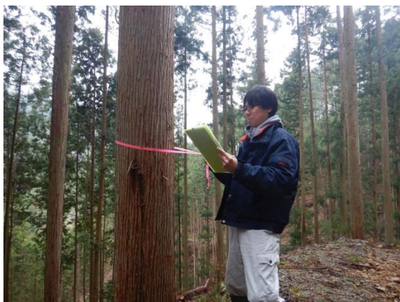
森林経営計画現地確認中

平成29年4月には、 この仕事を通じて、新しいパートナーができ、ラブラブな新婚生活♥を送っています。 益々頑張らないと、「尻に敷かれる～ヤバイ！！」