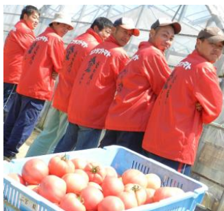
JA トマト部会青年部の皆さん。