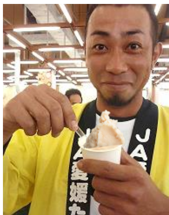
エコラプトマトのジェラート