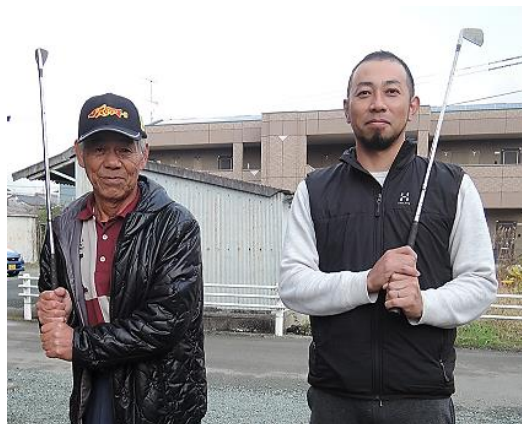
ゴルフと釣りが共通の趣味です。