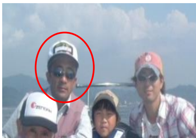
家族・友人と釣り