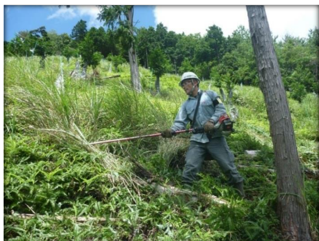
刈払機を使用した②下刈り作業