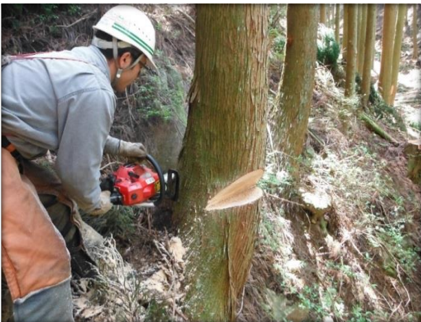
チェーンソーによる①間伐作業