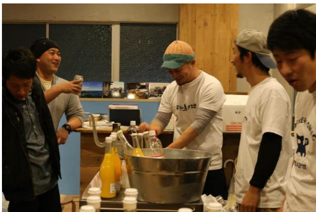
かんきつジュース試飲会

かんきつの加工品として、ストレートジュースはとても人気のある商品です。様々な品種の果汁を組み合わせれば風味の種類は無限大です。この面白さを消費者に伝えたいと考え、農業後継者 9 名を含む計 20 名で、“NPO 法人柑橘ソムリエ愛媛”を設立しました。その名前の通り、かんきつジュースのテイastingによるソムリエライセンス制度を確立するのが僕たちの目標です。試飲会や BAR イベントなど、メンバー全員で楽しみながら活動を展開しています。