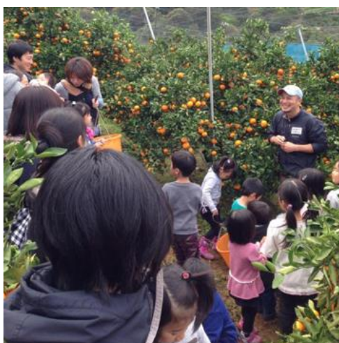
地域児童の収穫体験