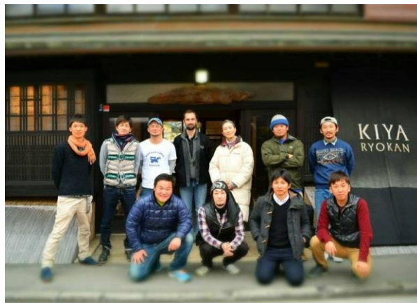
NPO 法人柑橘ソムリエ愛媛メンバーと