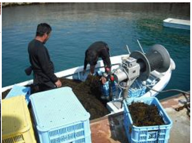
採取したヒジキ （4月下旬～5月中旬）