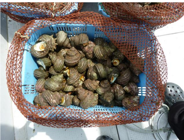
漁獲したサザエ （サザエは周年採れます）

それから8年ほど経ちましたが、 毎日がとても充実しています。頑張れば頑張った分だけ収入も増えるので、勤めていた時より大幅に収入も増えました。 また、今では地元の後輩を雇用できるまでになり、給料を振り込む度に責任感も強く感じています。