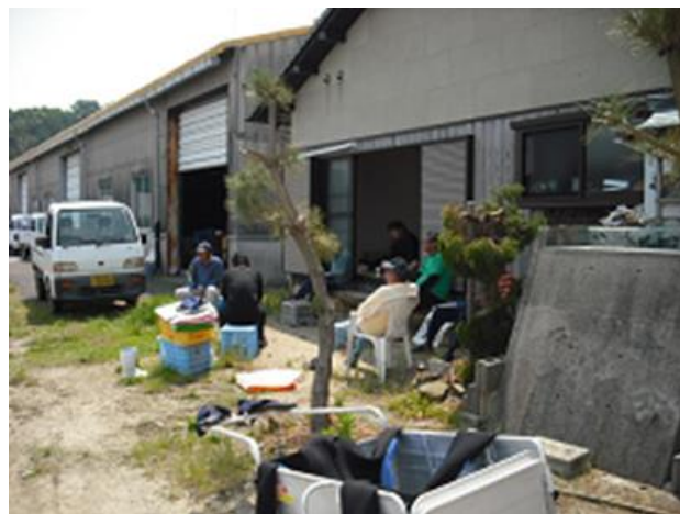
作業終了後の風景 （島の時間はゆっくり流れます）