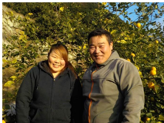
奥様とはめでたく昨年ご結婚！