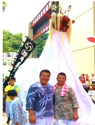
休日は地域のお祭りなどにも参加！