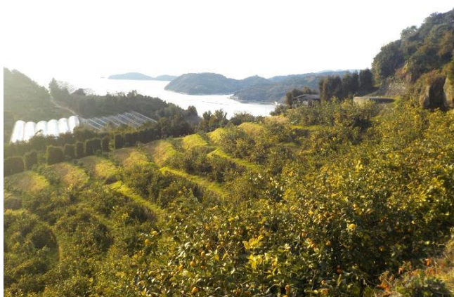
宇和海を臨む自慢のレモン園地

また、「様々な品種から搾汁した果汁の組み合わせによって、今までにない風味を持ったストレートジュースができる！かんきつの奥深さを消費者にもっと知ってもらいたい！」という思いを共に抱く 同地域の若手後継者と“NPO 法人柑橘ソムリエ愛媛”の設立に尽力し、現在も活動 しています。地域のつながりの重要性を感じたことは勿論、生果だけではなく加工品としても評価してもらえるかんきつの魅力を自分の肌で感じました。