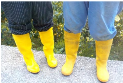
夫婦揃いの長靴で収穫！