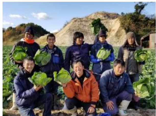
社員と収穫したキャベツでポーズ