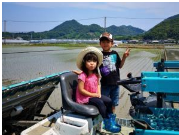
子供にも農作業体験

社員は、平均年齢 30 歳と若く、いろいろなことに挑戦する農業をしています。35 歳を目処に独立を目指し、自ら経営者になれるように会社にいるときから意識させています。