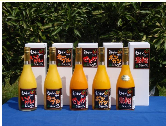
自慢のオリジナルジュース(果汁 100%)