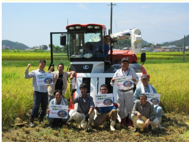
コシヒカリの収穫期を迎えて