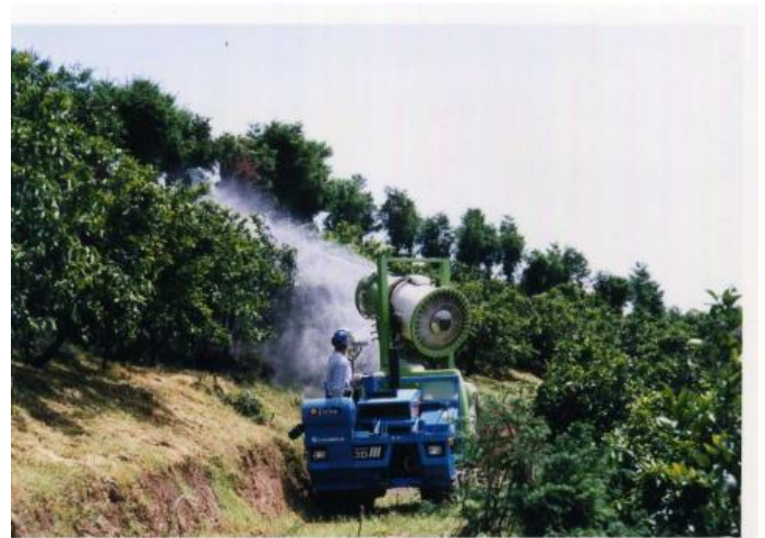
防除はスパウダー（防除機）で行う