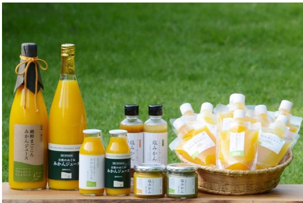
自社オリジナル商品