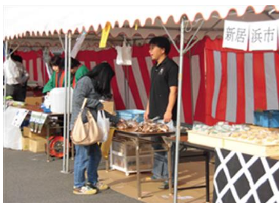
にいはま農業まつりでの販売

■しいたけの栽培に加えて、きのこ生産者への菌床販売やご家庭向けきのこ栽培キット（ よきっと ）の販売、きのこを使った加工品の開発など、 多方面に渡って事業を展開 しています。近年では、地元の高校と共同で小中学生向け教材の開発に取り組むなど、きのこの持つさらなる可能性を探求する活動も行っています。