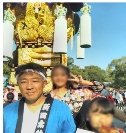
新居浜太鼓まつり