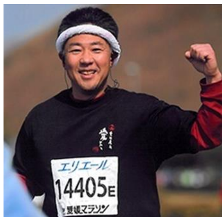
愛媛マラソン完走！