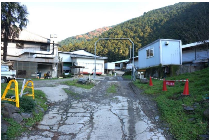
農場入口の車進入ゲート消毒散布を含め徹底した衛生管理を実践

さらに衛生管理面を押し進め、年2～3回の疾病モニタリング検査を専門機関に依頼して行うなど徹底した予防管理に努めています。