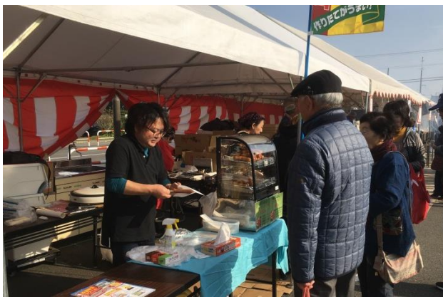
地元イベントでの販売促進活動