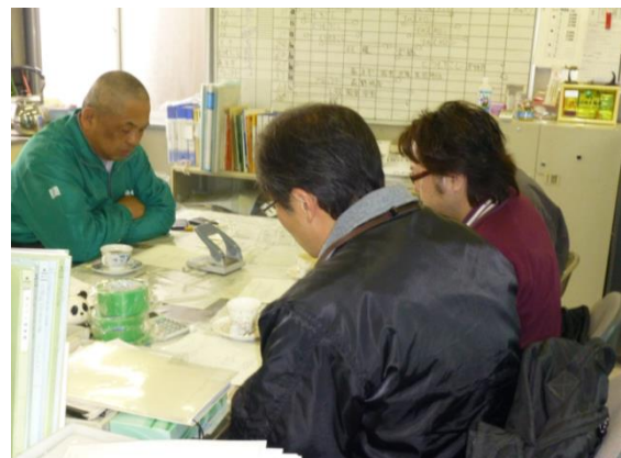
H25年から地元飼料米生産者との連携により飼料米給与にも取組中