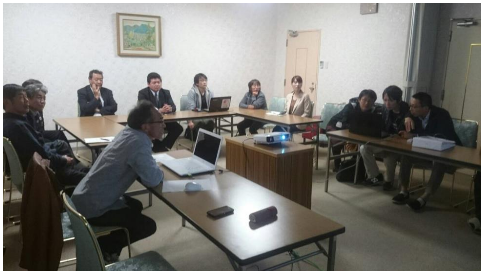
1か月おきの愛媛甘とろ豚普及協議会勉強会で情報交換