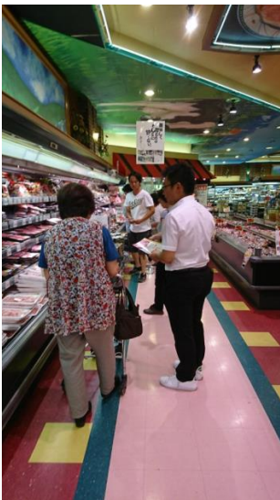
販売店での販促活動