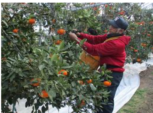
甘平の袋掛け作業

また、地域特性や気候変動等を踏まえ、常に新技術・新品種の導入を検討し、有益と判断したら素早く実践に移しています。近々、 全ての施設柑橘へのマルドリ方式(マルチ+ドリップ灌水)の導入、グレープフルーツの新規導入等を予定 しています。