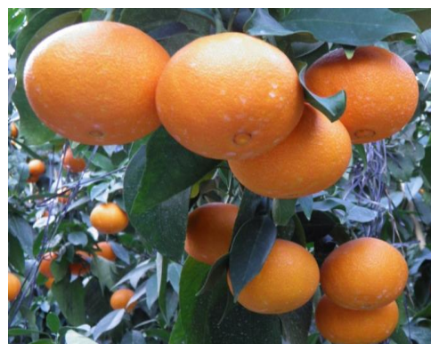
紅まどんなの結実状況