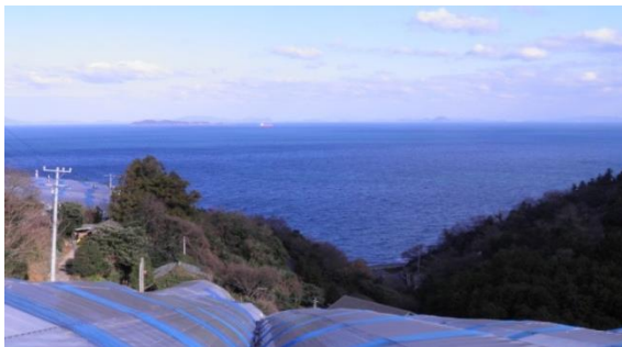
自宅周辺から見た穏やかな瀬戸内海