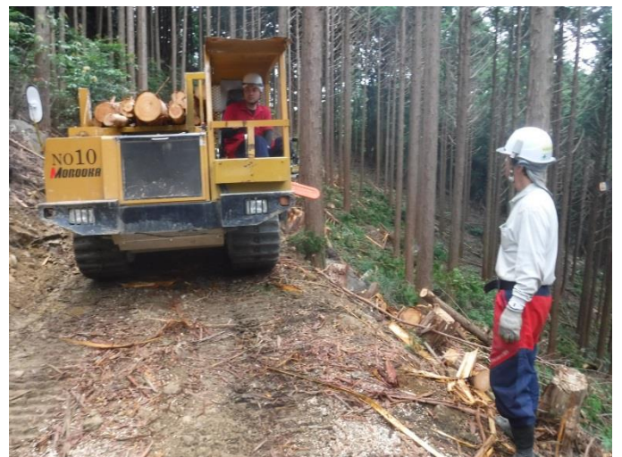
木材運搬中(フォワーダ)