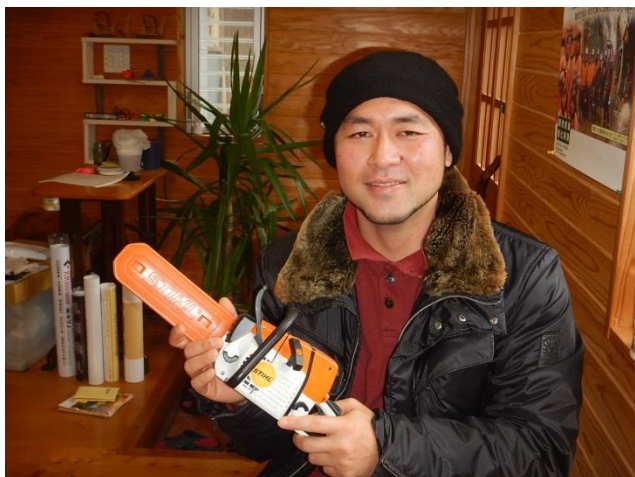
木造の事務所内にて