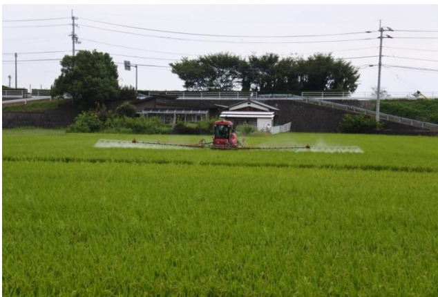
自走式防除機による薬剤散布（水稲）