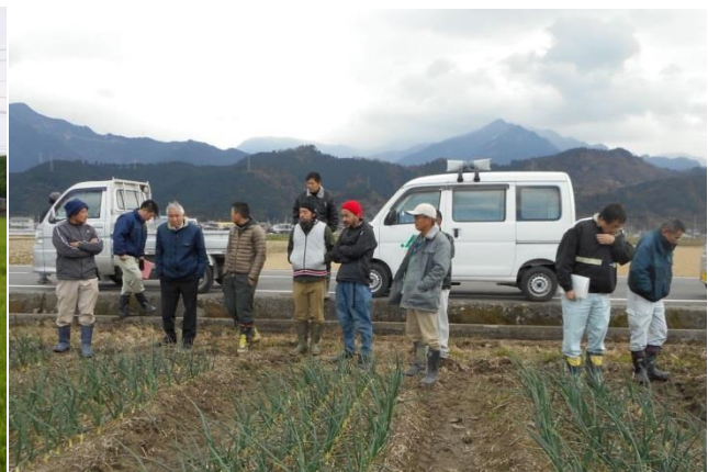
J A西条たまねぎ現地研修において 自らの栽培について説明