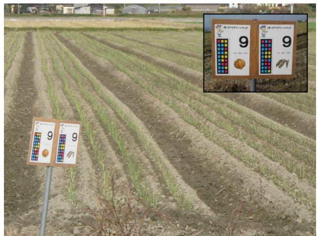
たまねぎ栽培圃場と「先端農業コンソーシアム」の取組みに基づくカラーコード（圃場毎設置）