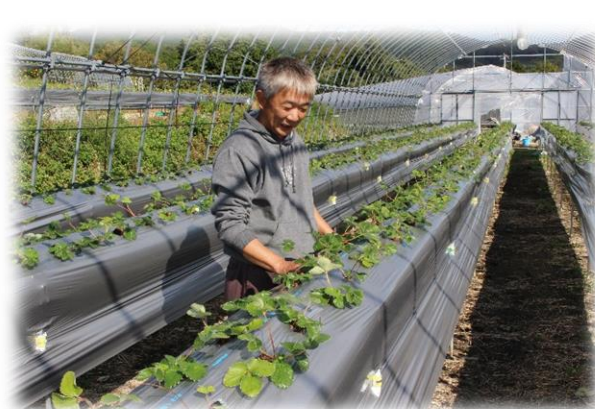
いちご定植後の管理