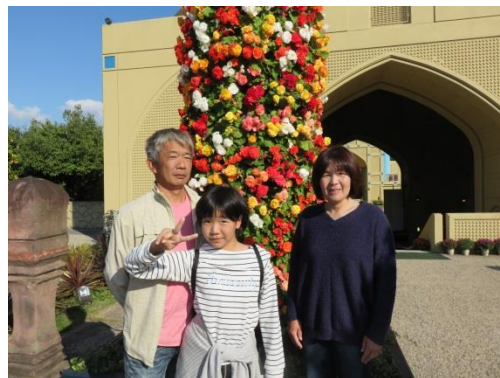
家族旅行でちょっと一息