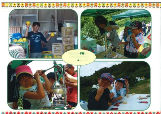
いーよ（テレビ愛媛）に出演