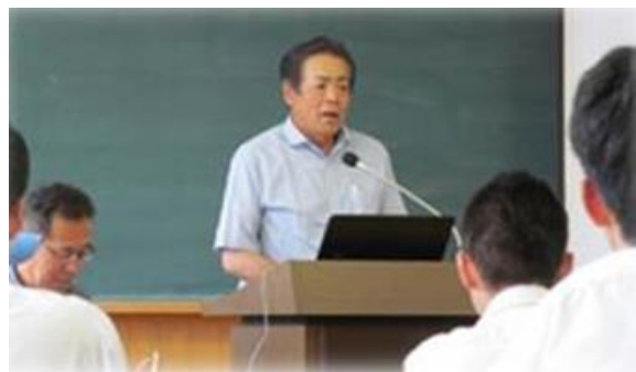
農高生への事例発表