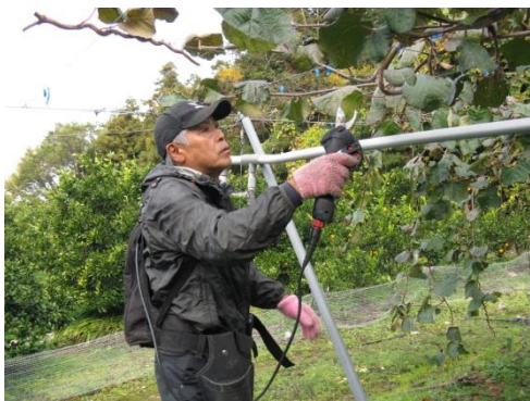
キウイフルーツの剪定作業