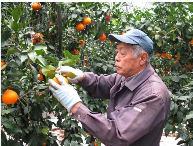
紅まどんなの収穫

最近では、紅まどんなのマルドリ栽培のほか病害虫にも強く手間がかからないアボカドが女性に人気があると聞いてチャレンジしています。