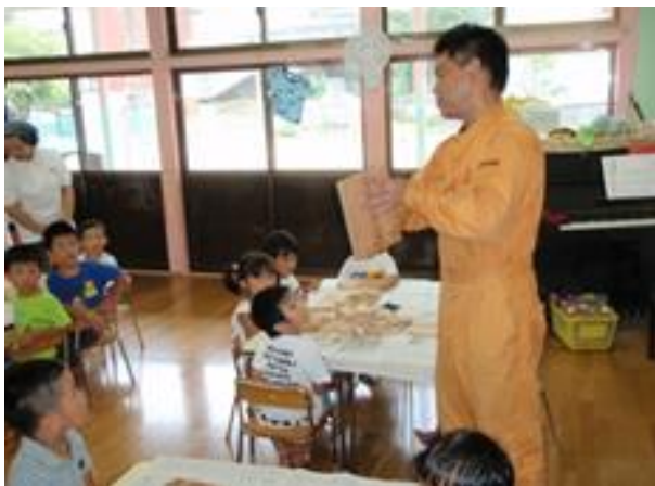
↑ 三瓶幼稚園対象の木工教室