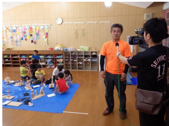
↑ ケーブルテレビのインタビュー