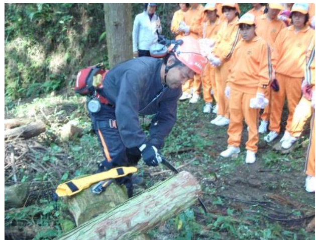
三瓶中学校対象の森林教室