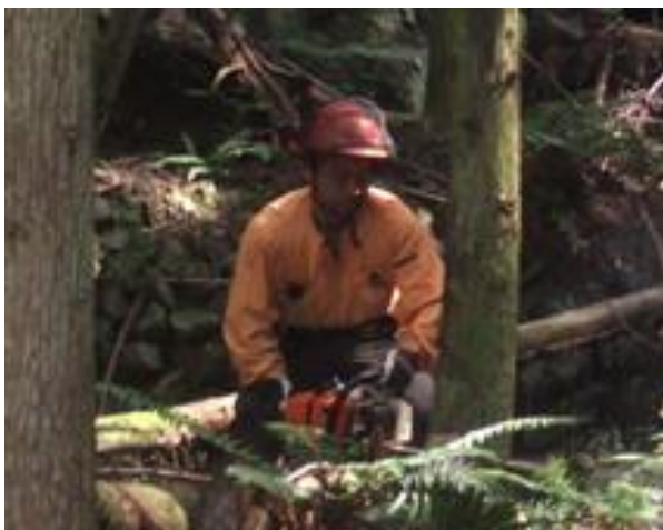
実際に山での作業の様子