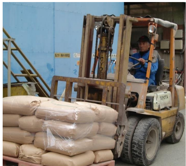
地域内外から頼まれ、稲刈り作業等の請け負いもこなす