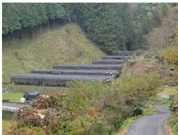
ほとんど自力で組み立てたしいたけの人工ほだ場