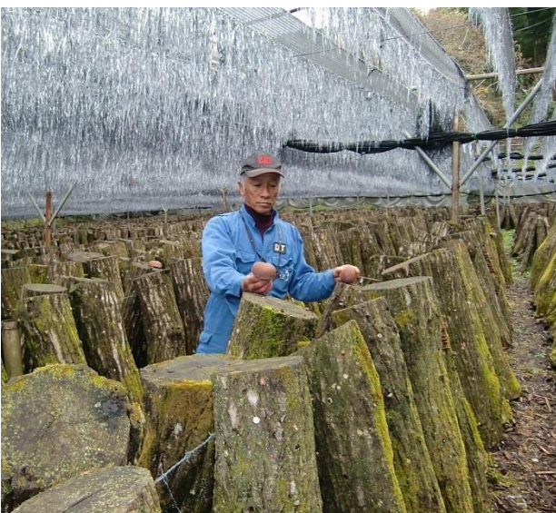
人工ほだ場でしいたけの安定生産を目指す

もともと大規模水田経営が可能な地域ではありませんが、一度荒廃すると二度と水田には戻せないという思いから、やれる間は続けていくつもりです。