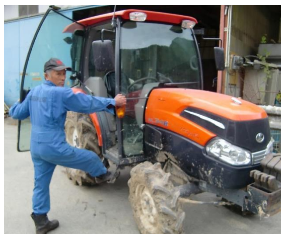
こだわりの農機具にはどれにも愛着が・・・