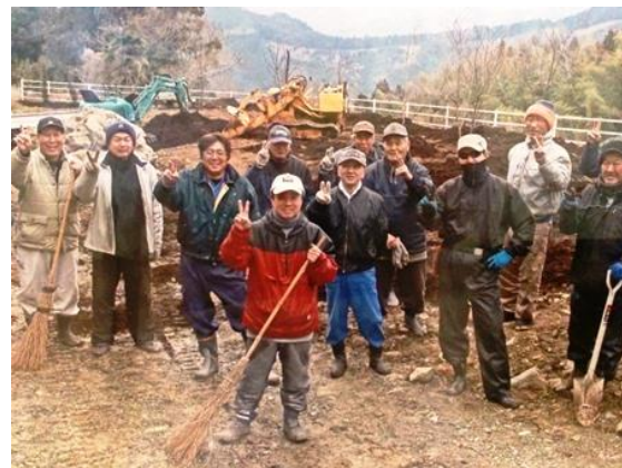
地域の仲間達と桜を植栽