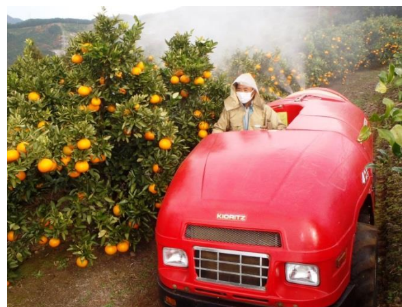
スピードスプレーヤで効率的な病害