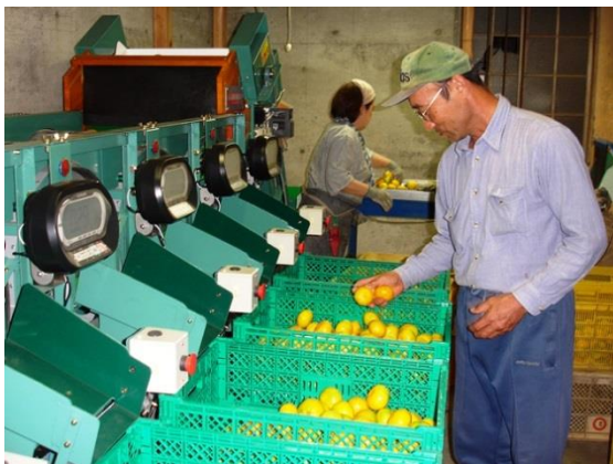
最新選果機で楽々選果