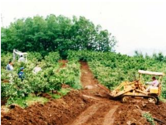
みかん園に農道を設置する作業風景

青色申告を親子で47年継続し経営の強みと弱みを把握することで、 経費の無駄を省いて農業所得向上 に努めています。