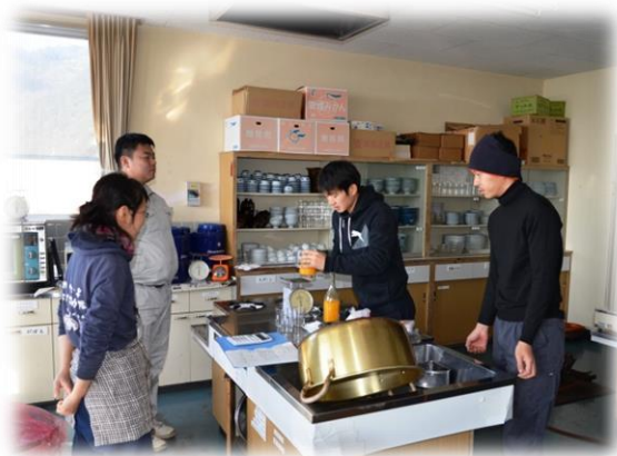
みかんジュースで加工品開発