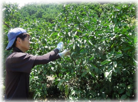
夏の摘果作業のようす

また、妻の出産時や育児にも家族が協力しあって、仕事や家事を分担できるのもサラリーマンの家庭に無い良さだと思います。