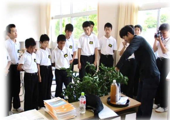
中学校での出前授業のようす