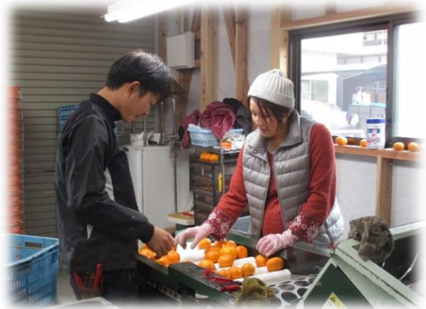
夫婦での選果作業