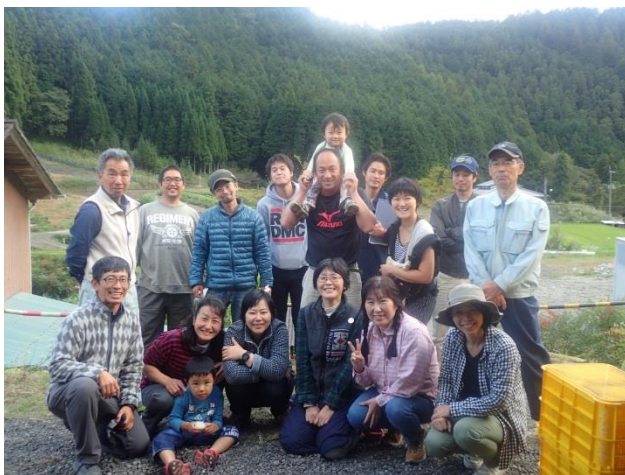
青年農業者の仲間と