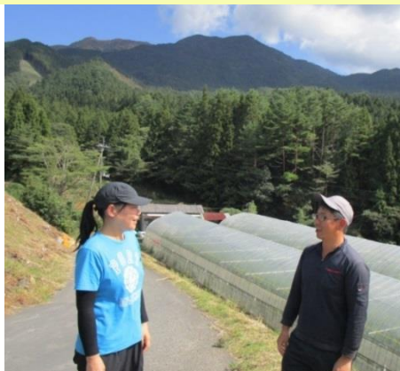
作業について話し合う

久万高原のトマト栽培では雑草の抑制や土づくりに萱を利用しているのが特徴です。作るならおいしいものをとの思いから、毎年萱を刈取って活用したり、栽培方法等の研究を重ねたりと手間は惜しみません。トマト栽培は奥が深くて面白いと感じています。