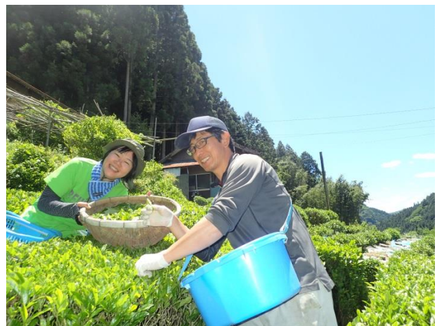
初夏にはお茶摘みも