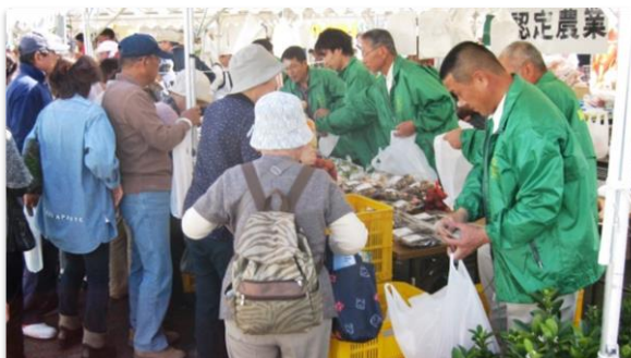
認定農業者協議会で特産品のPR活動