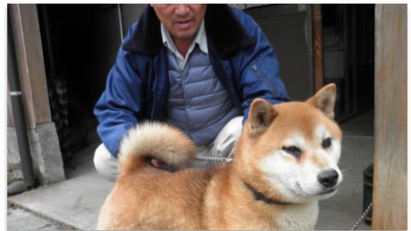
健康管理に、夕方は愛犬との散歩