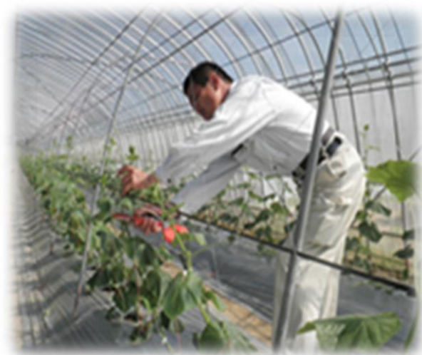
施設きゅうりの誘引作業

特にゆずは、加工向けのため、栽培にそれほど手もかからず、きゅうり、水稲と繁忙期の労働競合もなく、地域にあった作物だと思います。