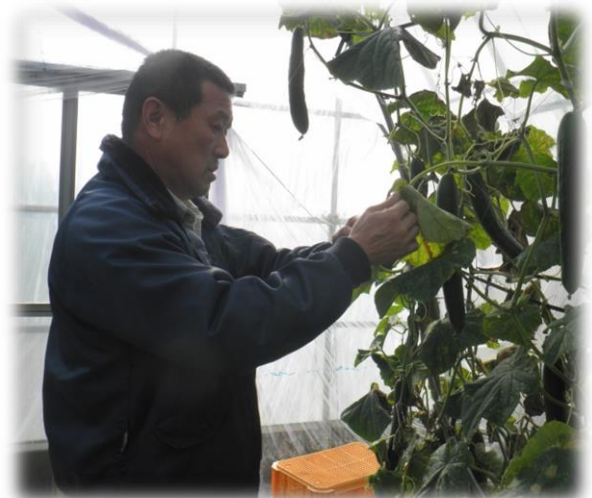
抑制きゅうりの収穫・管理作業