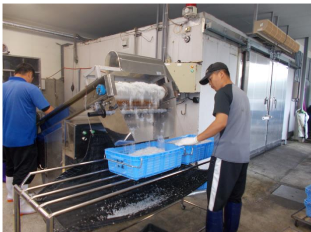
シラスの加工現場