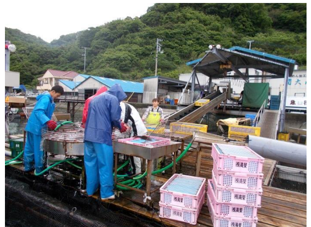
箱詰め出荷中（マダイ）