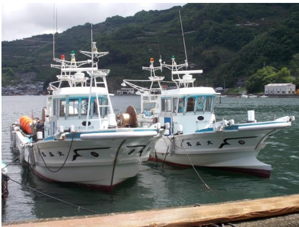
シラスを漁獲する漁船

養殖現場専門の従業員はいません。ちなみにパートさんもいません。従業員のうち半数以上が漁船漁業に従事していますが、禁漁期や時化などで手が空いた時には養殖現場に回ってもらいます。シラスの加工部門は機械化が進んでいて比較的時間の余裕があるため、基本的に養殖現場と兼務になっています。また、時には漁船にも乗り込んで経験を積んでもらいます。限られた労力の中で将来を見据えて柔軟に効率良く人を配置することをいつも心掛けています。