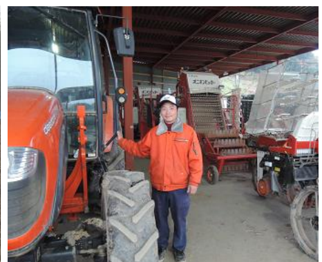
大型トラクターと国内最大級のたまねぎ収穫機(右手奥)等