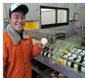
たまねぎ加工施設