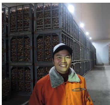
巨大なたまねぎ冷蔵施設