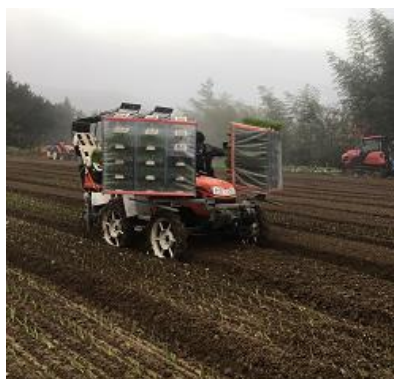
たまねぎ定植の様子