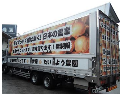
ラッピングが施された自社トラック