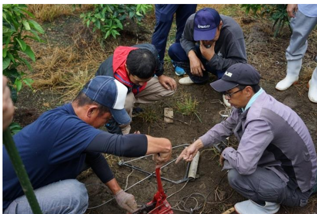
仲間とくくり罾研修