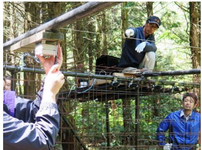
捕獲用の罠を設置する様子