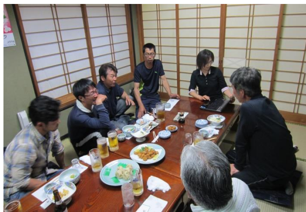
仲間とイノシシ捕獲談義