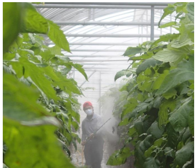
食の安全を守るため気門封鎖型薬剤を散布