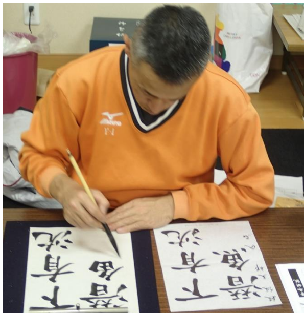
1日の作業を終えて