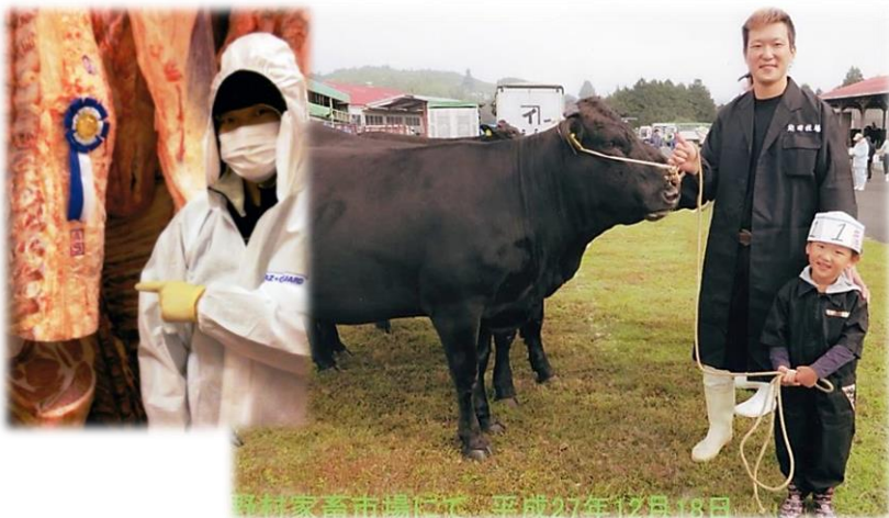
共進会への出品は仕事の励みに

和牛繁殖経営は母牛が妊娠してから子牛を市場に出荷するまで600日近くかかります。長期間大切に育てた子牛ですが、その値段は市場のセリで一瞬で決まるため、仕事の全てに自分の思いが詰まっています。気を抜けない大変厳しいものですが、 良い牛を出荷すればきちんと評価されるため、モチベーションを高く保って仕事ができます。