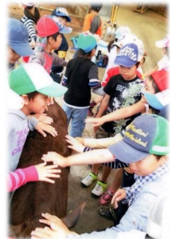
食農教育など、地域活動への協力も積極的に行っています