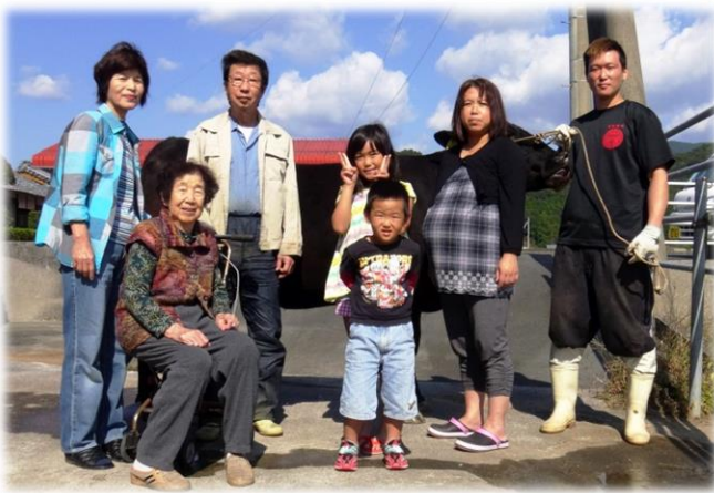
支えとなってくれている家族