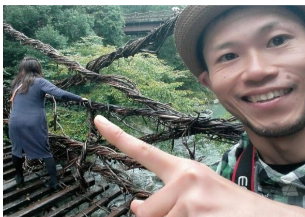
家族との充実した日々