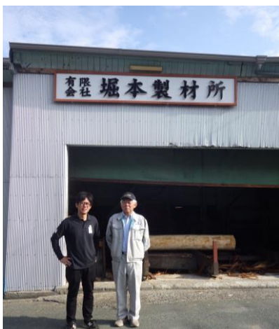
4 代目（写真右）と 5 代目

思っていた以上に人口減少や少子高齢化が進んでいました。また、製材所も時代とともに少なくなっていました。今、製材所は私と同年代の後継者が Uターンしてがんばっています。気持ちの良い人達ばかりで、相談に乗ってくれる良い先輩方です。