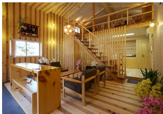
堀本製材所の事務所