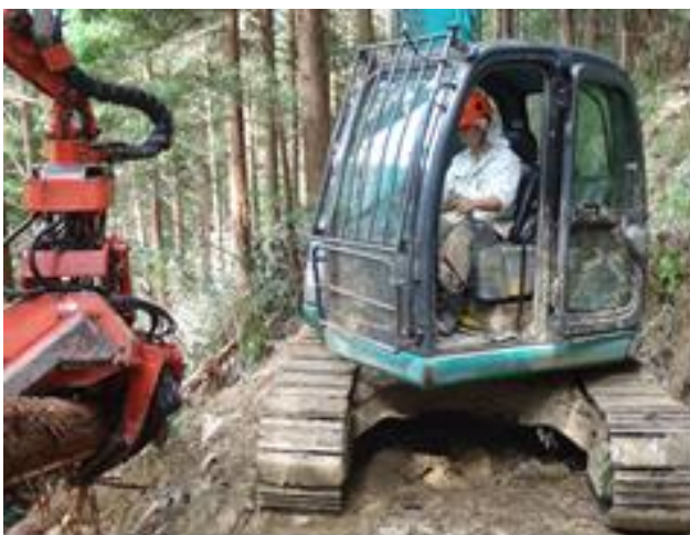
プロセッサによる造材作業

林内作業車の運転に始まり、今ではプロセッサによる造材、フォワーダーでの搬出、バックホーでの作業路の開設に取り組んでいます。それ以外にも測量業務やトラック運搬など、幅広い仕事を覚えている最中です。