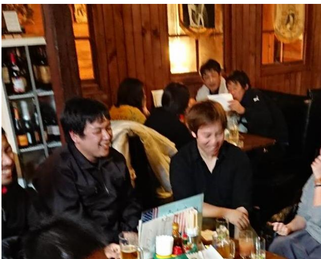
南予地域の林業・木材産業の若手懇親会