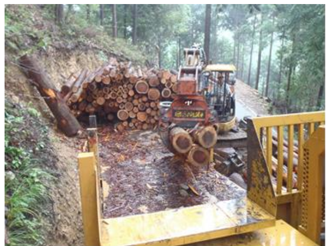
グラップルによる集材作業中