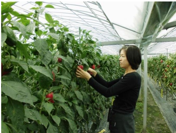
パプリカの管理をする様子

お客様のことを第一に、①美味しいものを一年中食べてもらうため、商品が途切れないように努めています。②店舗で 直接お客様と話をし、お客様の嗜好を確認 しながら、品目や品種を検討しています。