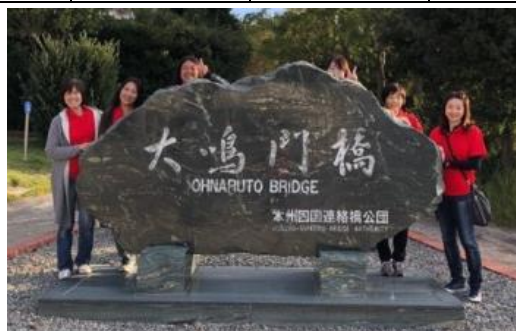
「たべとうみん」メンバーと一緒に