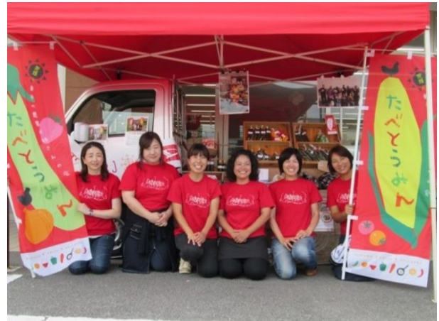
“たべとうみん” のメンバーで軽トラ市！！