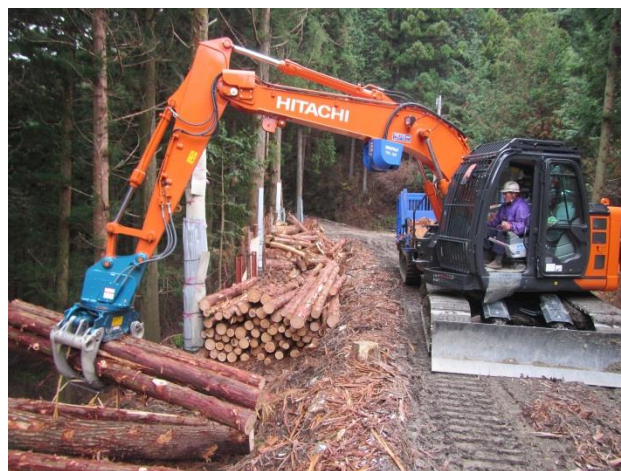
山土場への搬入状況