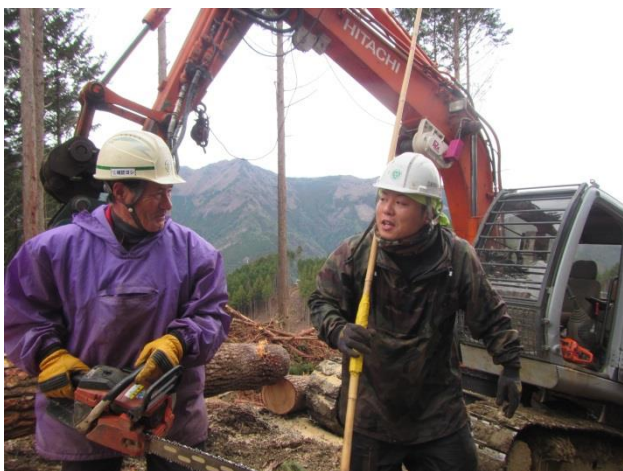
若手従業員への指導状況

また数年前からは世代交代を行う準備も進めており、娘婿や地元の若手を雇用して人数を増やしています。これからもずっと地元で林業が続けられればと思っています。