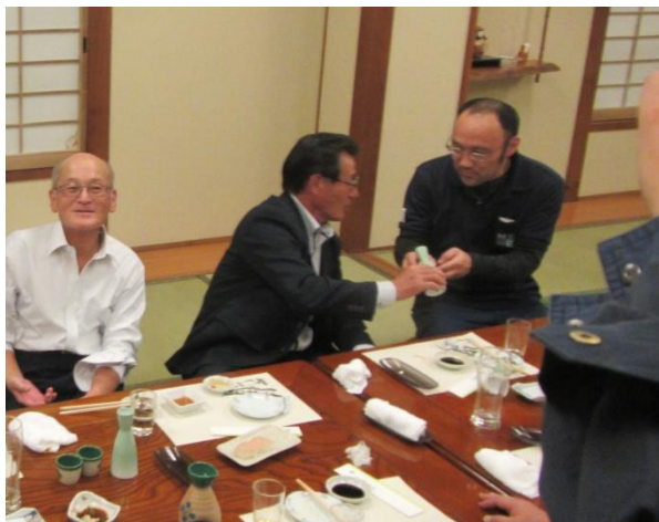
地元の仲間たちとの懇親会