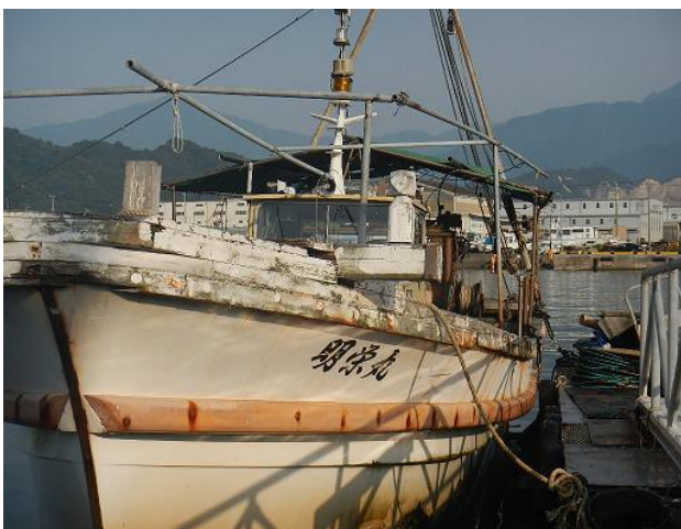
自慢の小型機船底びき網漁船

どのような仕事でも、先生がいなければ成長しないのと同じです。漁師についても自分が身を以て経験していますから断言できます。