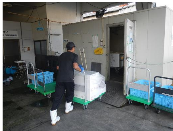
出荷用冷蔵庫に保管。本日の作業終了。