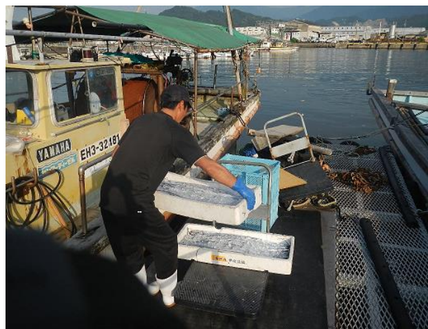
今日はタチウオが獲れました