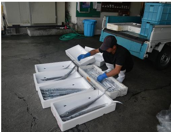
特大・大・中・小に選別