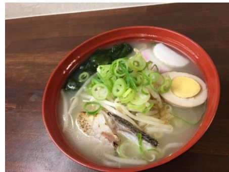
真ハタらーめんなどの商品開発にもチャレンジ