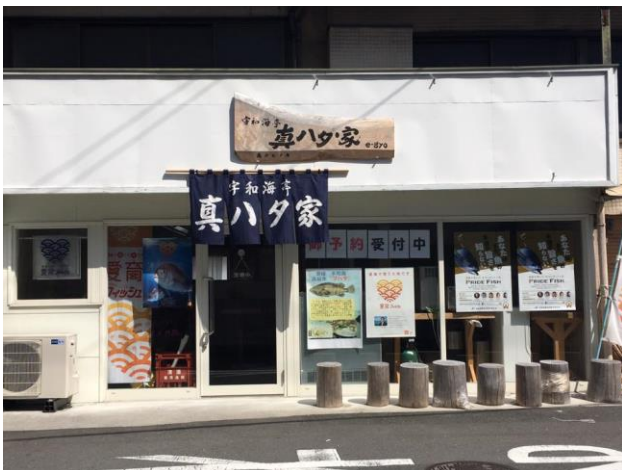
宇和海亭 真ハタ家 e-gyo

お客様から直接、自分の生産した魚を美味しいと褒めていただけることは、生産し、出荷するだけでは得られなかった喜びがあります。