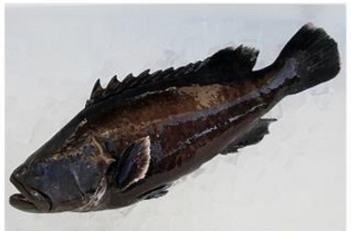
愛育フィッシュ・『幻の高級魚』マハタ