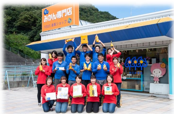
会社の前で社員たちと

これからの農業にはトータルデザインが大切と会社設立時から重視し、制服やロゴマーク、パッケージ等洗練されたデザインのものを採用し、 農業分野を一企業として確立させるようにしています。