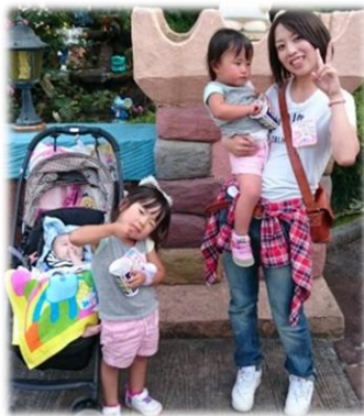
3人の子供たちの母親です