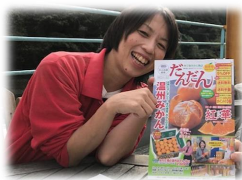
商品と会社の取組をまとめた情報紙も作成しています