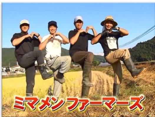
地域を担う仲間たちと共に！！

最近では、私の願いが叶ったのか、長男と次男が「将来は農家を継ぎたい！」と言ってくれるようになり、秘かに喜んでいるところです。