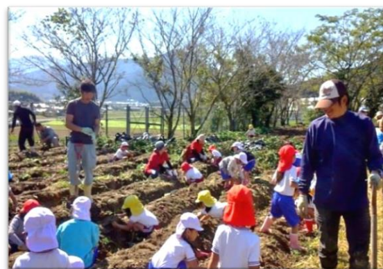
地元園児とのサツマイモ収穫体験