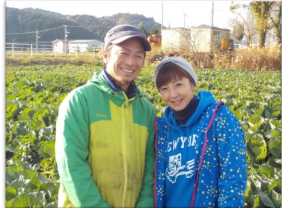
仲良しの奥様と一緒に