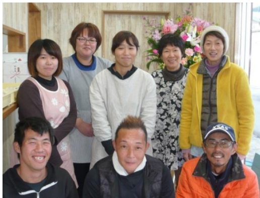
あう農園を支える社員