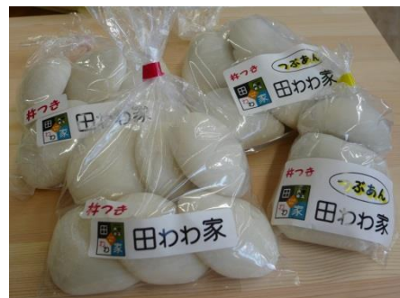
加工場「田わわ家」のもち