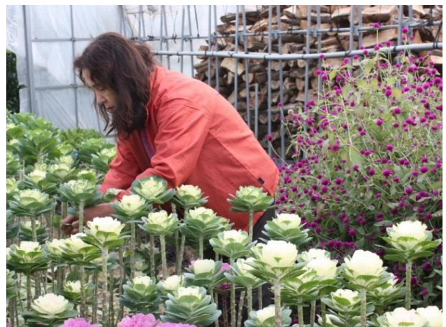
作業風景（ハボタン）