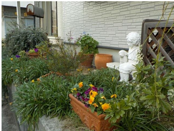
自宅前のガーデニング