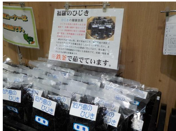
人気商品「福羅のひじき」