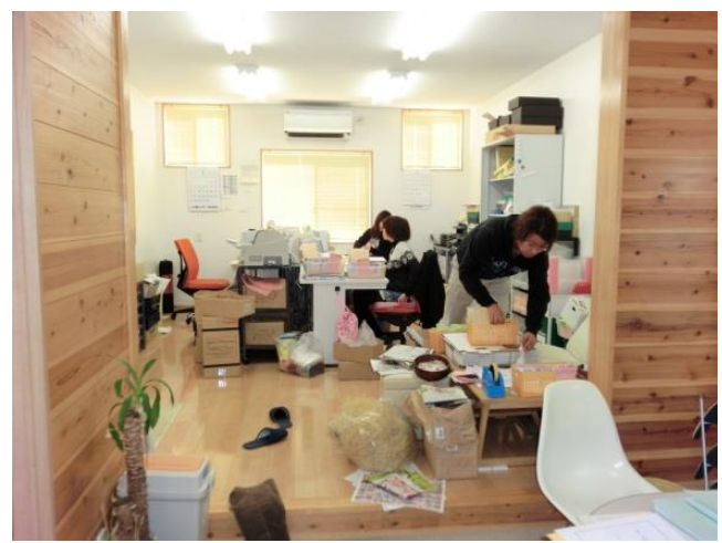
出荷繁忙期はスタッフと事務所内で執務