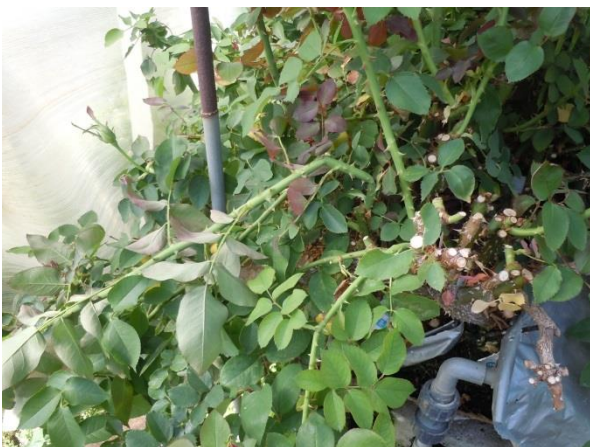
バラの「アーチング栽培」のポイント「捻枝」

※「アーチング栽培法」は、高須賀朝三氏、横田禎二氏、富樫康雄氏等により共同開発されたバラ切り花栽培法。ひと株のバラを採花用の新梢部（シンク機能）と生長のための養分確保の枝葉部（ソース機能）に分業させ、枝葉部をアーチ状に折り下げ的方法により株元に光が十分にあたり、たくましい新梢が発生し、水揚げが良く、スプレー品種（枝分かれして多くの花をつける品種）ではスプレー率が高い等、高品質のバラが育つとされる。