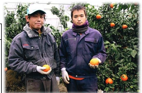
左：息子さん 右：研修生